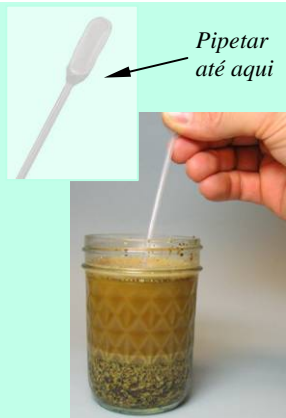
Evitar extrair partículas junto com o líquido