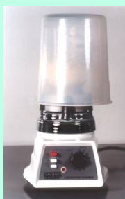
Triturar a amostra