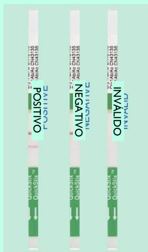
Qualquer linha rosa visível no lugar da Linha de Teste é considerado um resultado positivo