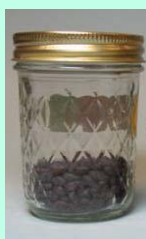
Tamanho das amostras