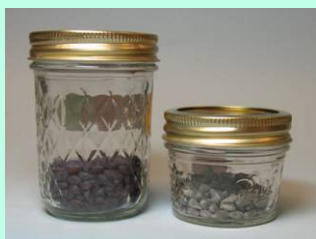
Tamanho das amostras