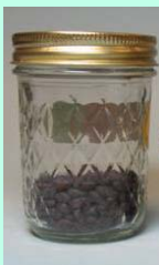
Tamanho das amostras