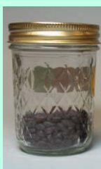
Tamanho das amostras