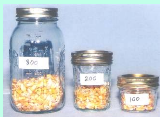
Tamanhos de amostras