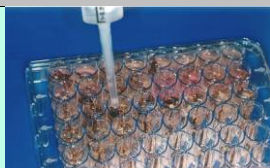
Adicionar tampão de extração