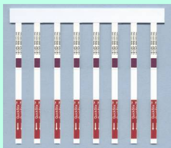
Remover os QuickStix Combs